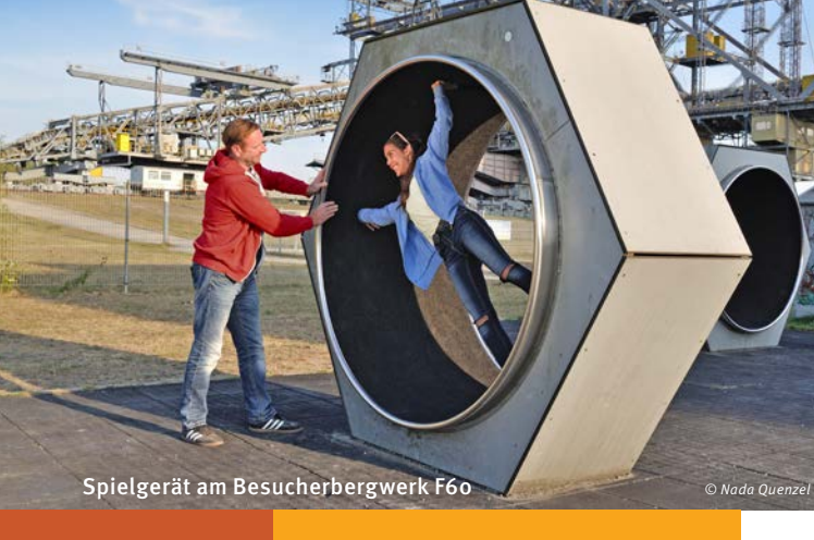
Spielgerät am Besucherbergwerk F60