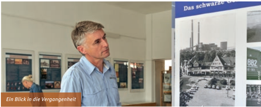
Ein Blick in die Vergangenheit

zum 7 Stadthafen Senftenberg . Hier empfängt die Besucher maritimes Flair und eine frische Brise. Aus der Tagebaukante wurde ein moderner Hafen. Auf der Terrasse des 8 Cucina Restaurant & Café ist nicht nur der Seeblick ein Genuß. Gut einkehren kann man auch auf der anderen Straßenseite des Steindamms im 9 Hotel-Restaurant Lido , dem größten Holzblockhaus Europas. Direkt am Radweg gelegen findet man auch 300 bis 500 Meter weiter das 10 Strandhotel und die 11 Brasserie , beide mit Seeterrasse.