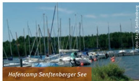
Hafencamp Senftenberger See

Auf dem Seerundweg geht es weiter Richtung Großkoschen. Vor der Ortschaft den Koschener Kanal überqueren, der den Senftenberger mit dem Geierswalder See verbindet. Es gibt viele Strände am Senftenberger See, aber in Großkoschen lohnt es sich besonders, eine Pause einzulegen. Wie wäre es mit einem erfrischenden Bad? An der 14 Strandpromenade Großkoschen lassen sich Hunger und Durst wunderbar stillen.