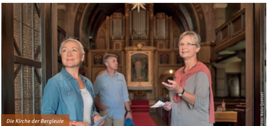
Die Kirche der Bergleute

Weiter geht es durch die Ortschaft Großkoschen, vorbei am Familienpark Senftenberger See bis zum 15 Hafencamp Senftenberger See . Auf der Terrasse des