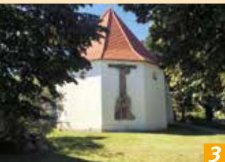
Peter- und Paul-Kirche