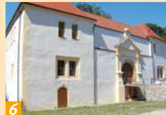
Theater „Neue Bühne“